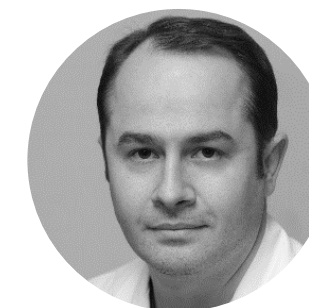
ДЖИНДЖИХАДЗЕ Реваз Семенович Главный внештатный нейрохирург