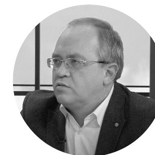
ЛАРЬКОВ Роман Николаевич Главный внештатный сердечно-сосудистый хирург