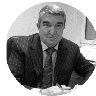
ЕГОРОВ Виктор Иванович Главный внештатный оториноларинголог